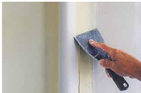
Lissage de l'enduit après pose de la bande Ultrabull (angle arrondi)