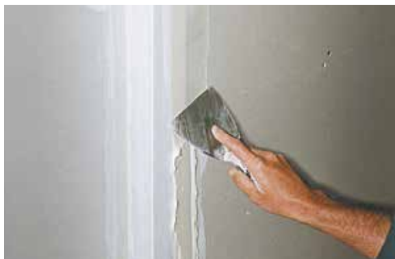
Lissage de l'enduit après pose de la bande Ultraflex (angle sortant)