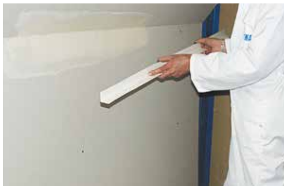
Pose de la bande Ultraflex (angle rentrant)